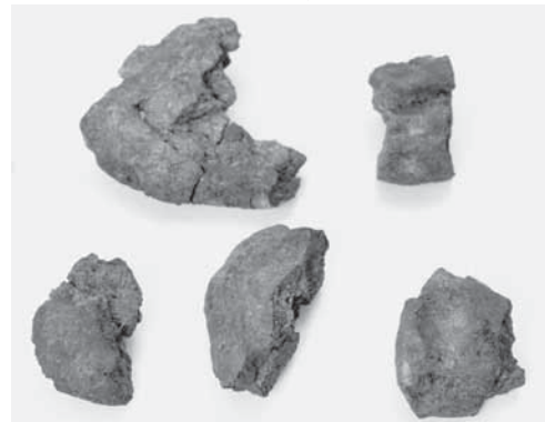
写真3 紋様があるクッキー状炭化物（S=80%）