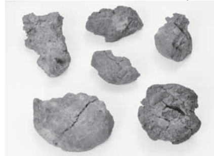
写真4 「だま」状のクッキー状炭化物（S=80%）