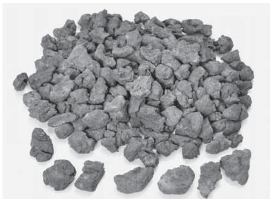
写真2 SX111出土のクッキー状炭化物の一部

のものである。まだ水洗別作業を行っていない土壌サンプルがあることから、さらに増える可能性もある。クッキー状炭化物は、扁平なものや、窪みや円、あるいは弧を沈線で施したもの（写真3）そして「だま」状のもの（写真4）がある。中には、断面形状が上面と下面が緻密で、中間に空隙がある三層構造を呈したものや、指先の痕跡と考えられるものが残ったものもある。遺跡からは、大量のクリの子葉・皮やオニグルミの殻が出土していることから、“クッキー”の素材には、クリやクルミが用いられた可能性が考えられる。他の可食植物も利用されたかもしれない。