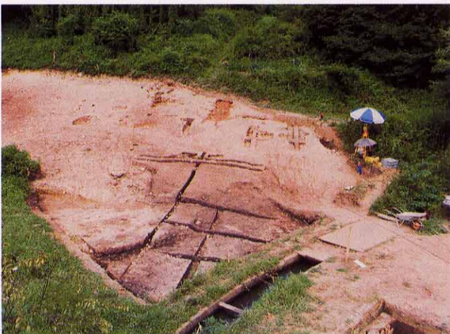
SQ1, SQ2 窯跡 東から