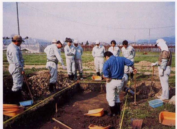
新任職員現地研修