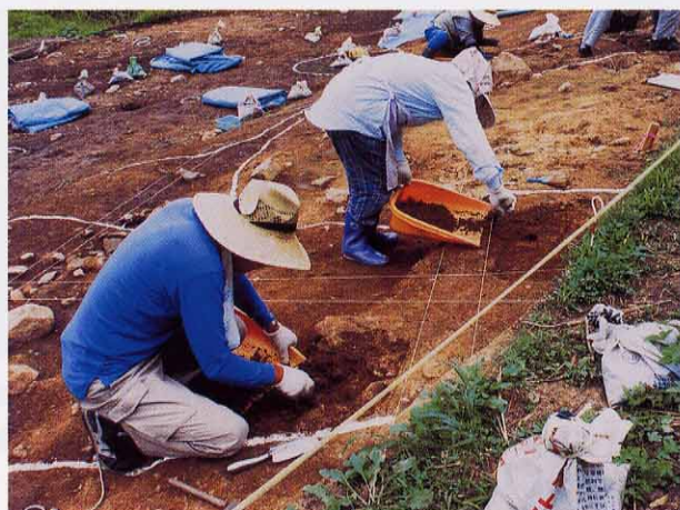
オサヤズ窯跡調査風景