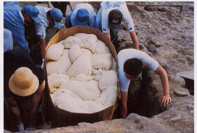
⑥ 緩衝材で全体を覆ったら、土台の棒を持ち上げ取り上げる。