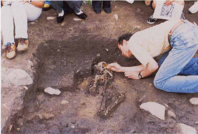
② もろい部分を樹脂で補強する。