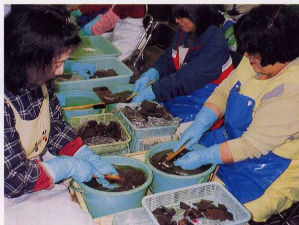
遺物洗浄作業風景