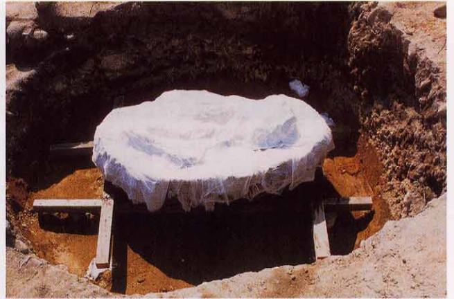
④ 全体を紙で覆い終わった様子。