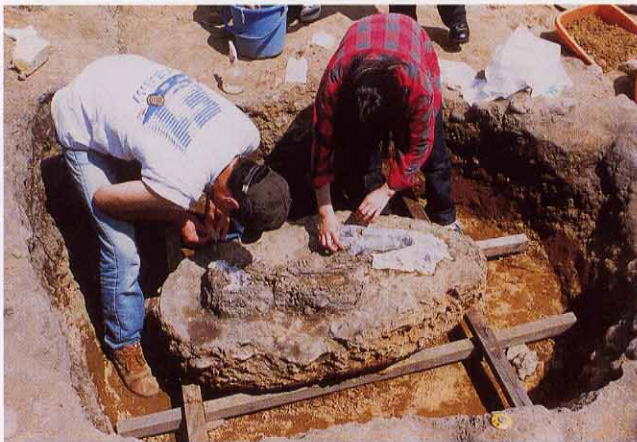
③ 周りを掘り下げ、取り上げ用の棒を設置する。 骨に緩衝材が着かないように濡らした紙で覆う。