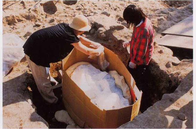
⑤ 緩衝材を流し込むため段ボールで囲う。 発砲ウレタン（緩衝材）を周りから流し込む。