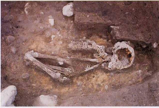
① 人骨の出土状況、腰の部分が残っていない。