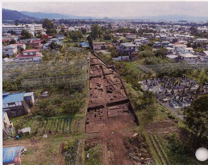
南区第1面調査状況

左奥の小学校が本丸にあたります。調査区の土塁左側が二の丸、右側が三の丸にあたります。小学校のそばには国指定特別天然記念物の大ケヤキが見えます。