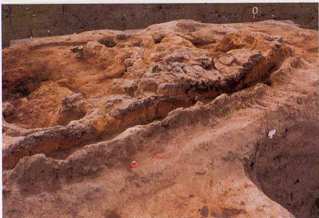
製鉄遺構（上段）同土層段面（下段）

平安時代の炉跡が3基重なって見つかりました。土層段面では土が赤く焼けただれている様子が分かります。