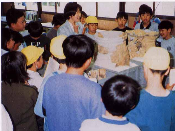
上山市立南小学校6学年施設見学