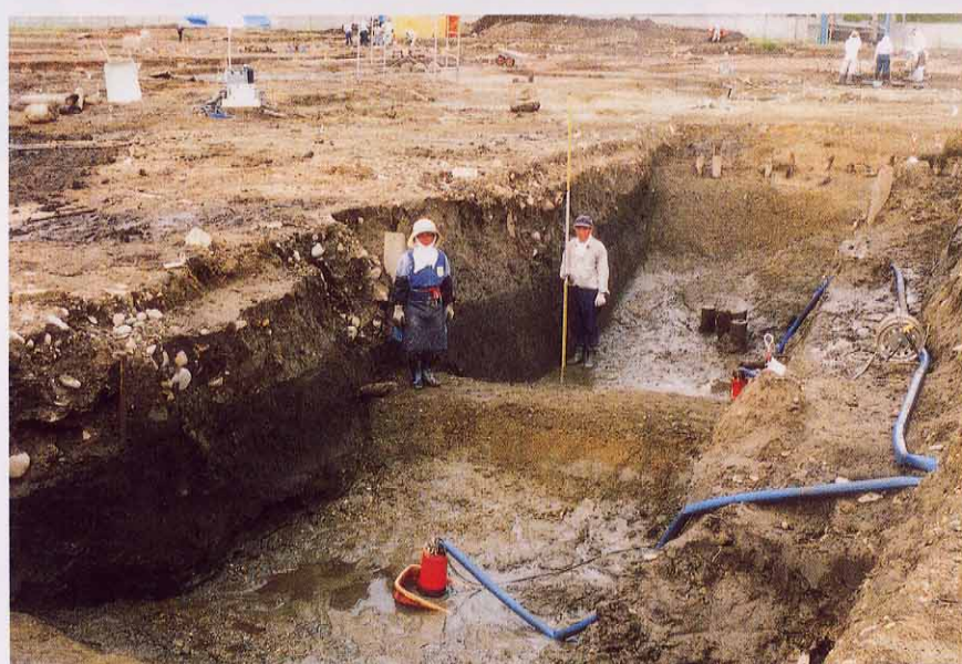
堀底、畝の検出状況