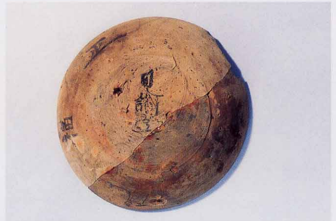
かわらけの底に墨書「正福院」