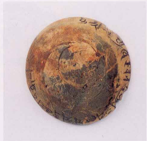
かわらけの縁に光明真言を墨書