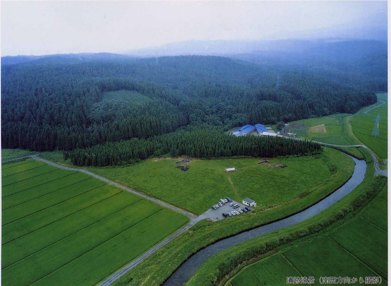
遺跡遠景（南西方向から撮影）

小山崎遺跡は1995年県教育委員会により発掘調査され、その出土品の質、量から見て注目に値する遺跡であることが判明しました。このたび山形県立博物館により重要遺跡の確認調査が1998年の7～8月におこなわれました。ここではその成果の一部を紹介したいと思います。