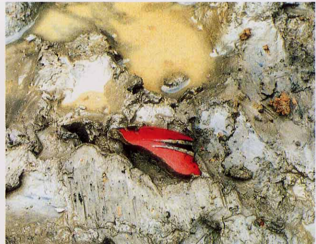
漆塗り木製品出土状況