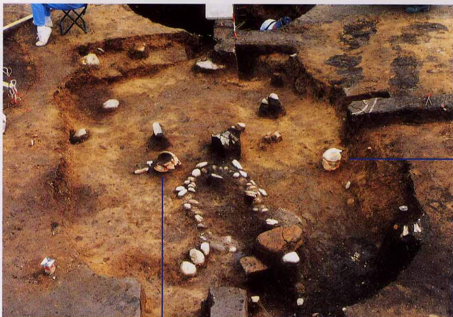
石囲い炉がある竪穴住居跡