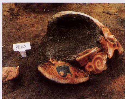
逆さに伏せられた土器上半分の出土状況

八ツ目久保遺跡では ぼてい 馬蹄形に石で囲った炉を持つ、竪穴の住居跡が見つっています。左上の写真にあるように、床に深鉢が上下半分に割られ、分割されて置かれており、その特異な出土状況が目立ちます。底部が伏せられた土器の中には、入れ子状態で小型の打ち欠かれた土器の胴部が入っていました。そのかたわらからは磨製 まぜい の石斧 せきふ が刺さって出土しています。これは住居から離れる際におこなわれた、おまじない まじない のような儀式 しき の跡ではないかと思われます。