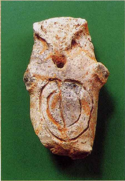
イノシシ形土製品（腹面）