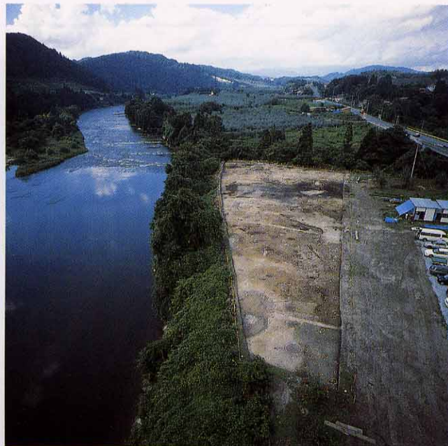
遺跡遠景と最上川（南方向から撮影）

当時の人々は、水や魚を求めて山を下りてきた動物たちを しと 仕留め、生活の かて 糧としていたのでしょう。「母なる川」最上川は動物たちにとっても、縄紋時代の人々の生活にとっても、なくてはならない存在だったことが発掘調査からもくみとれます。