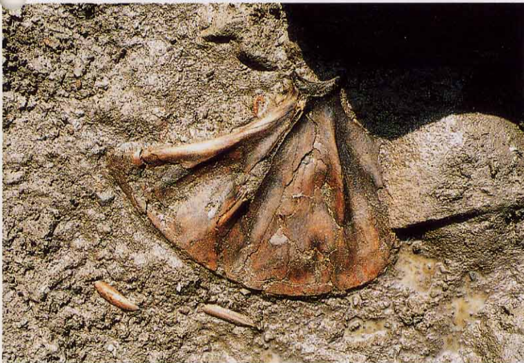
海獣の肩甲骨出土状況