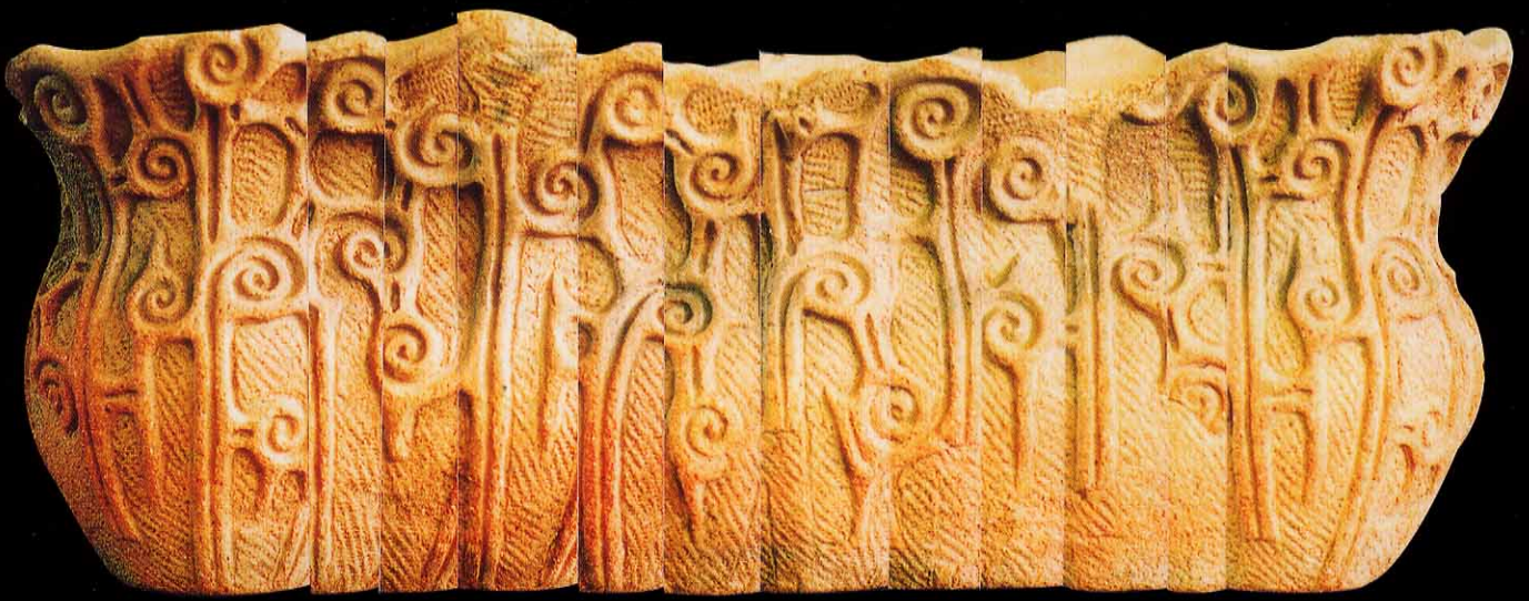
縄紋土器深鉢 大木8 b 式期