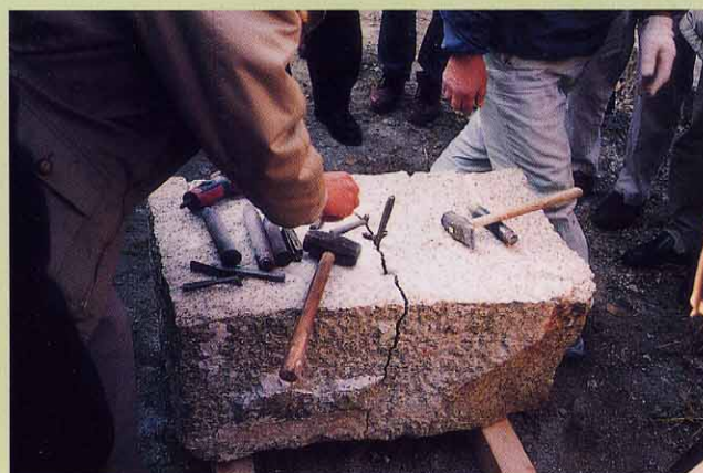
クサビによる石割り