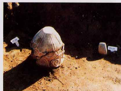
逆さに伏せられた土器の中に、入れ子状態でさらに土器が入っている、右は突き刺さった状態の磨製石斧。