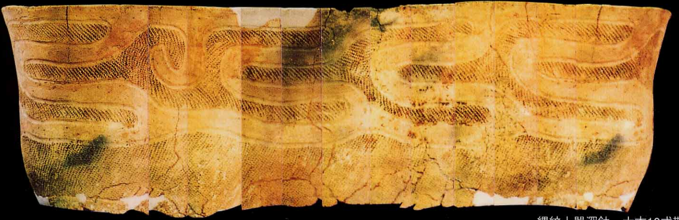
縄紋土器深鉢 大木10式期