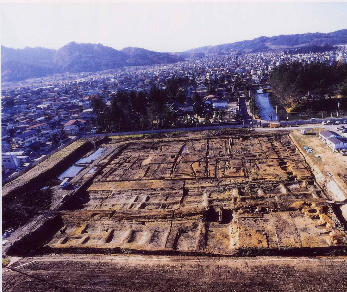
調査区近景（北方向から撮影）