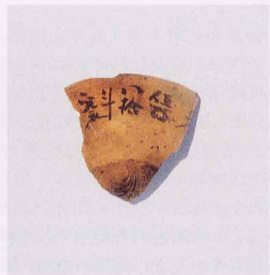
かわらけの墨書「伍百八拾斗 寛永」