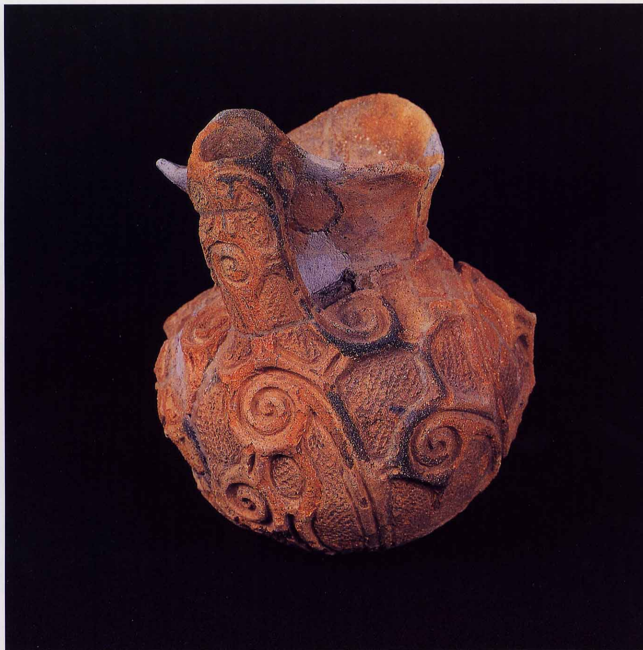
朝日町八ツ目久保遺跡出土の注口土器