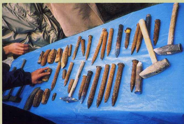
石割の道具 タガネとゲンノウ

も進んできています。研修の期間は短かったですが、非常に中身の濃いものでした。今後学んだことを機会ある毎に活かしていきたいと思います。