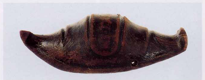
イノシシ形の漆塗り木製品