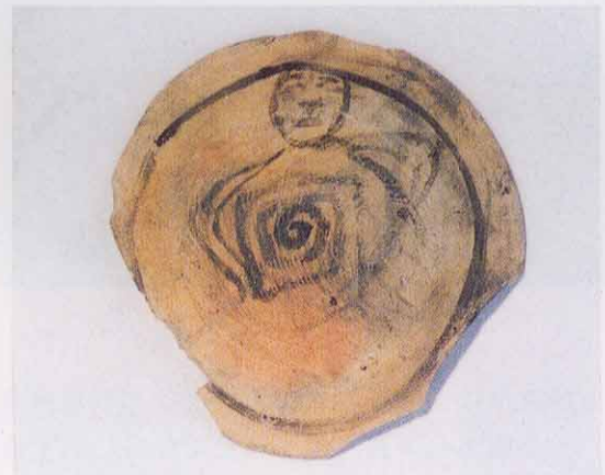
かわらけの底に人面墨書