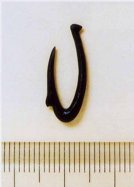
骨で作られた 釣り針