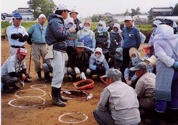
遺構の掘り方を学ぶ作業員・西谷地遺跡