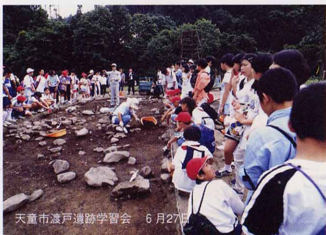
天童市渡戸遺跡学習会 6月27日

編集後記 ■天童市渡戸遺跡の学習会へ取材にいきました。土器の出るたび沸き上がる子供たちの歓声にシャッターチャンスだとばかりにリリース！でもなかなか思うようには撮れません。 ■梅雨明けの便りに2号をお届けします。現場の皆さん暑さに負けず発掘調査頑張ってください。(安部)