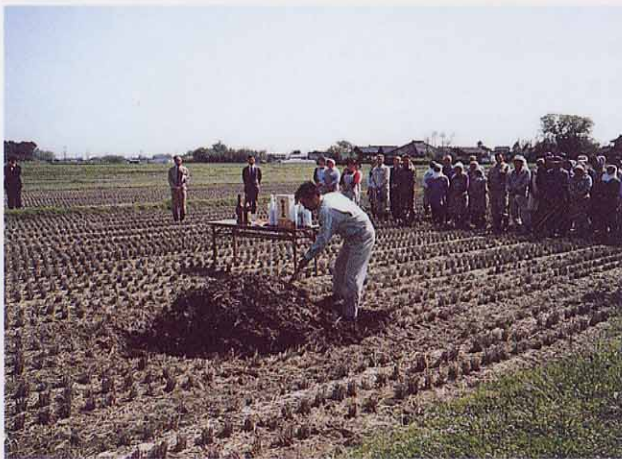
調査の安全を願っての鍬入式