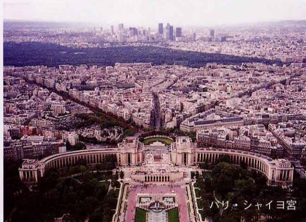
パリ・シャイヨ宮

第一印象は平日にもかかわらず人が多いこと、特に子供が多いことです。おどろいたことに大部分が入館無料で写真撮影やスケッチが許されています。そこには熱心にデッサンする画学生タイプの人や、床にはいつくばってスケッチする子供達がありました。一つ一ついいねに子供に教えている父親の姿がありました。無心に、それでいて楽しげに展示説明を読む老夫婦がいました。どれをとってみても今の日本の博物館、美術館ではあまり見られない光景でした。博物館や美術館がごく自然に生活の中に溶け込んでいる、そんな印象を強く受けました。