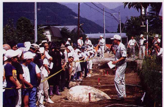
調査説明会・上荒谷遺跡