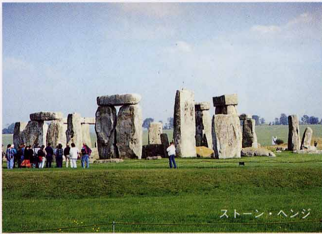
ストーン・ヘンジ

ゆるゆるとした平原に忽然とストーン・ヘンジは姿を現しました。ストーン・ヘンジの傍らには一直線に走る道路と駐車場があるだけです。見渡す限りの草原に白く光る石のモニュメントはどしんと根を下ろしていました。駐車場からほどほどの距離があり、回りに比べるものがないせいか、さほど大きさを感じませんでした。しかし一歩また一歩その構築物に近づく度に、大きさは増し、ついには圧倒的な存在感で迫ってきました。しばらくの間ただ呆然と眺め、ふらふらと歩くだけでした。長い年月が経っているにもかかわらず、今まさにその時間の中にいるような錯覚さえ覚えました。