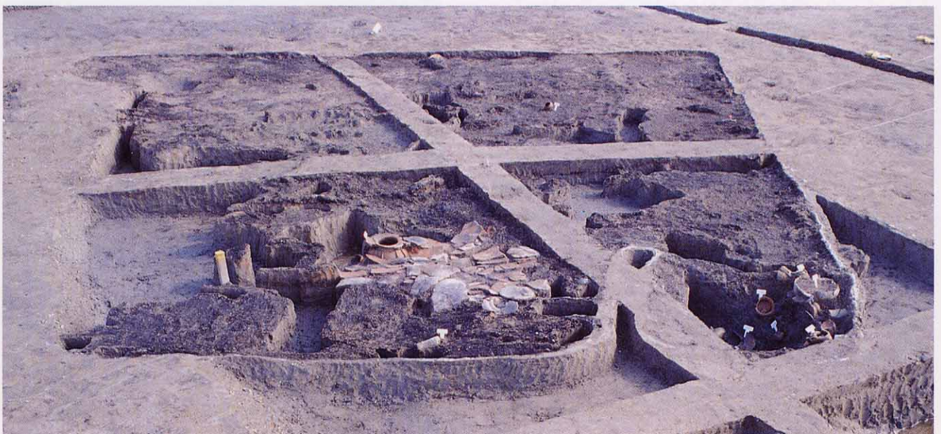
▼ S T 708竪穴建物跡・焼失家屋