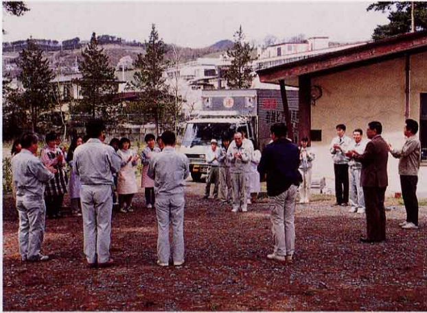
発掘調査の出発式