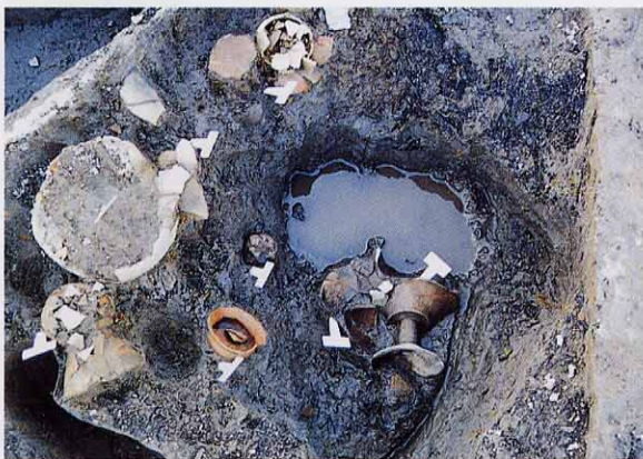
▲ S T 708土器出土状況

平安時代には家や倉庫の跡、井戸跡、水を引くための溝跡などがあります。これらの中からたくさんの土器や木製品が見つかりました。注目されるものとして、「仁寿参年」銘(853年)の年号が書かれた木簡、陰陽道の呪いに使ったような人物を描いた土器、いろいろな文字や記号をしるした墨書土器などがあります。