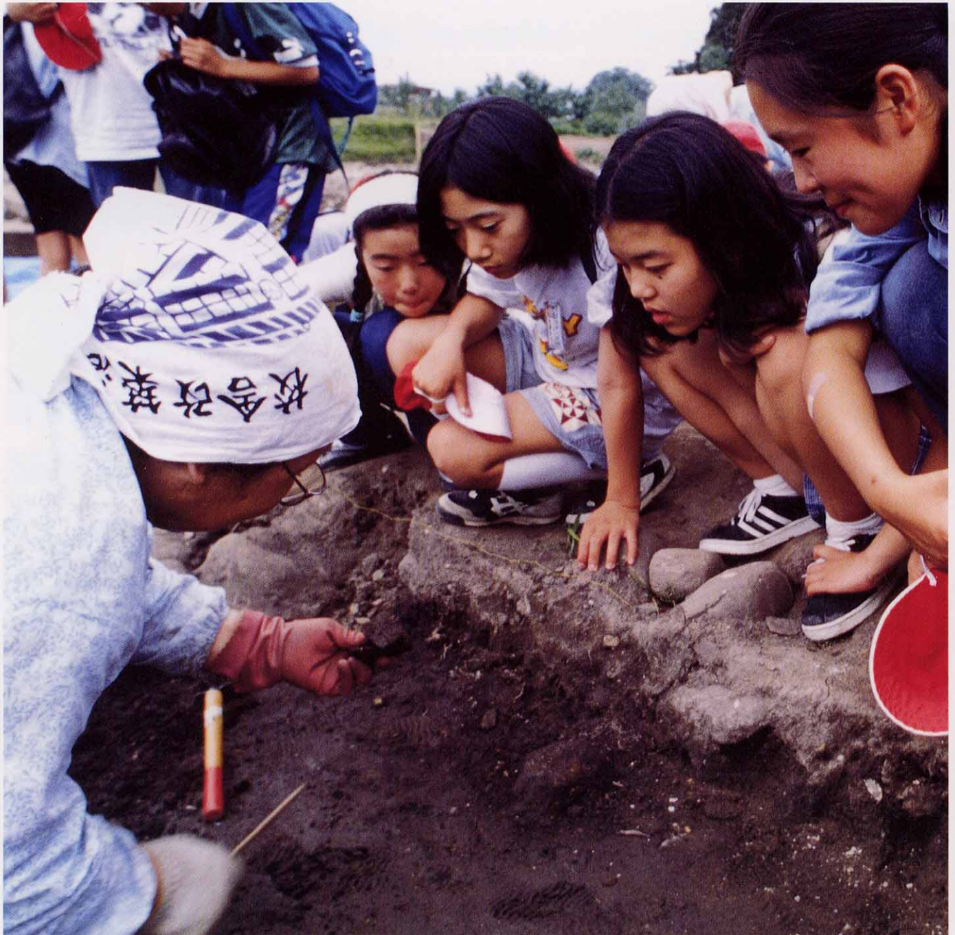
天童北部小学校6年生遺跡学習会、天童市渡戸遺跡にて