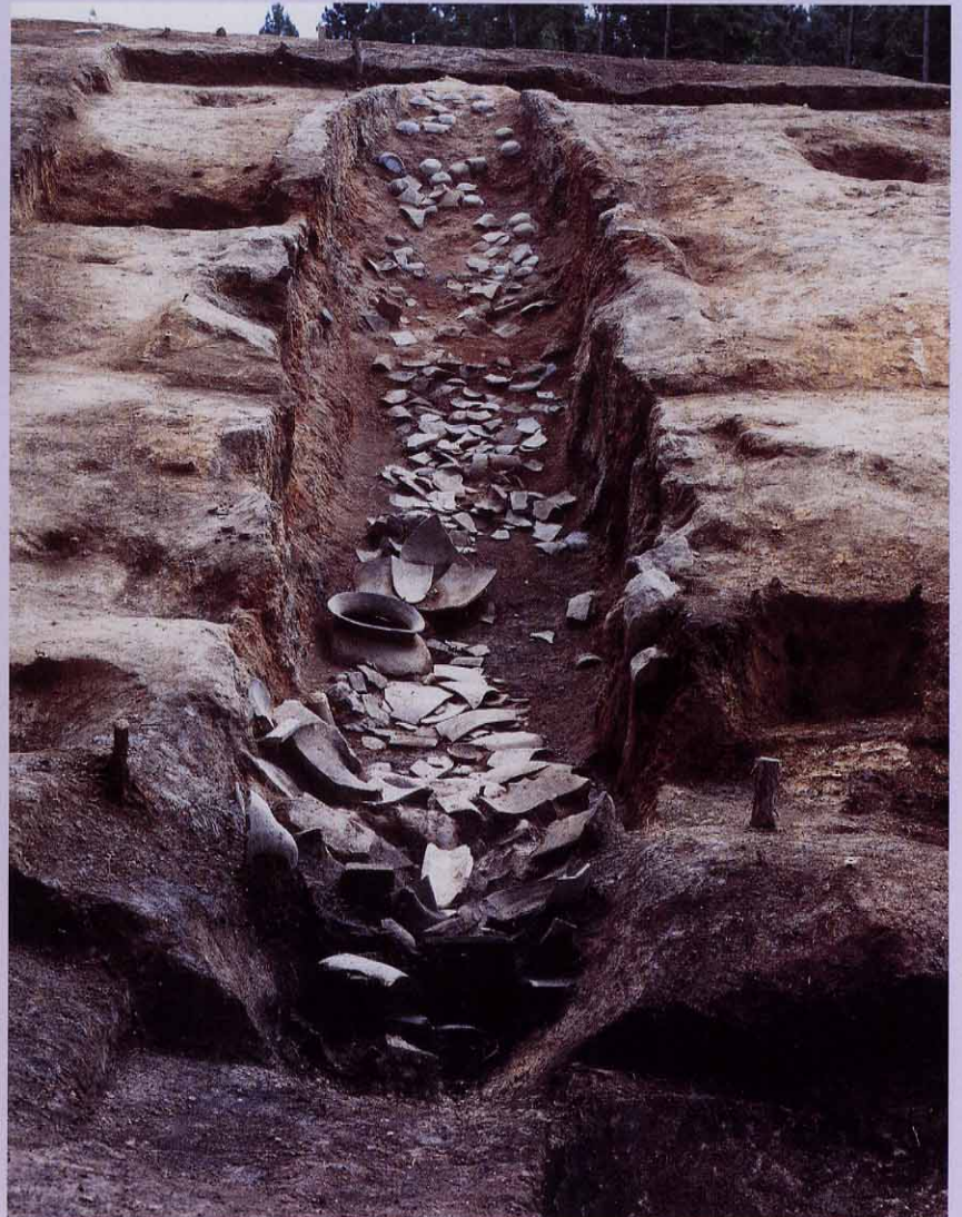
土器や瓦がたくさん出土した様子