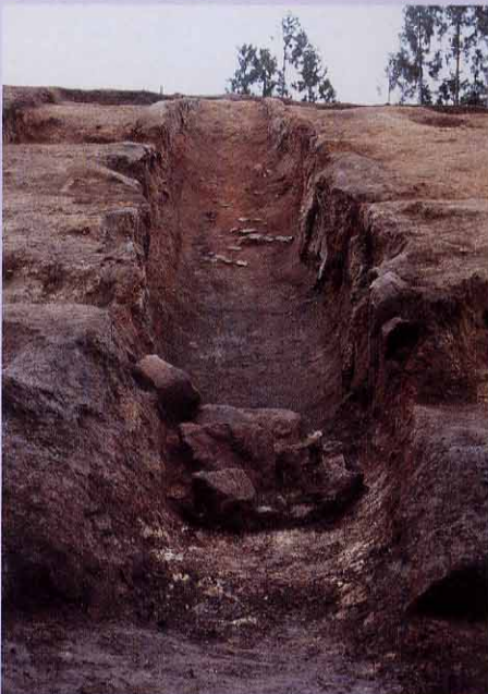
掘り上がった登窯