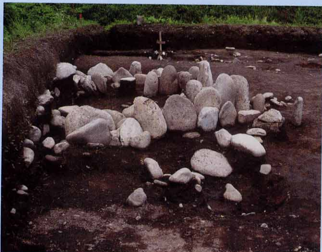
環状配石遺構の想定復元