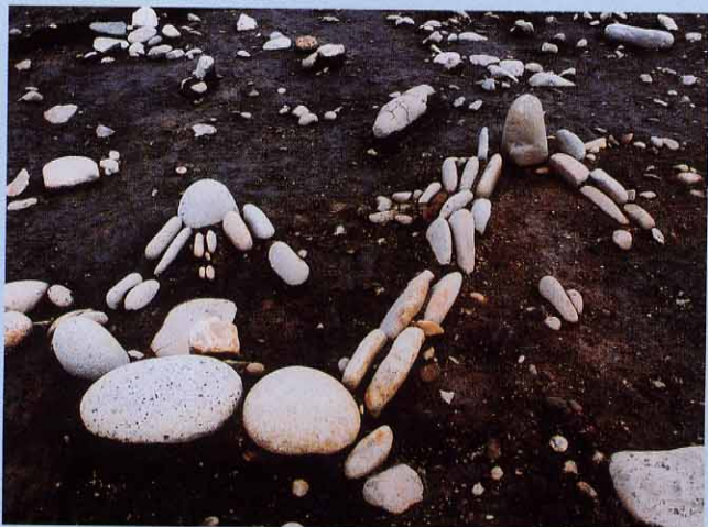
配石遺構群の一部