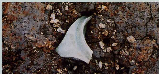
上の溝跡から出土した中国産の青磁片