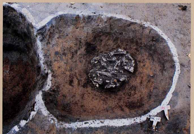
土坑墓（白いものが骨片）