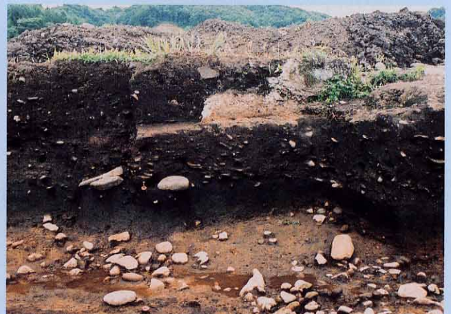
土器捨て場の土層断面 (多数の土器がささっている)