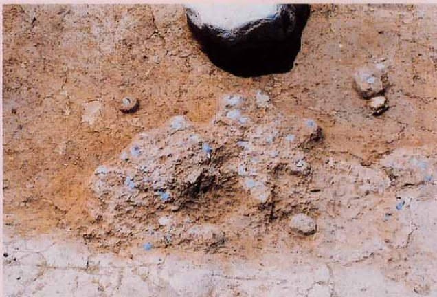
多量の石屑：竪穴から多量の石屑が出土し、土ごと採取しました。