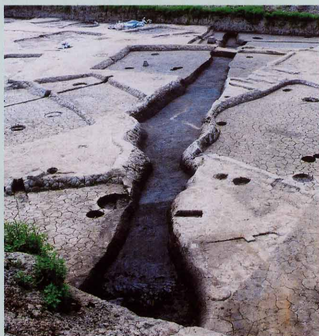
竪穴住居跡群を切る中世の溝跡