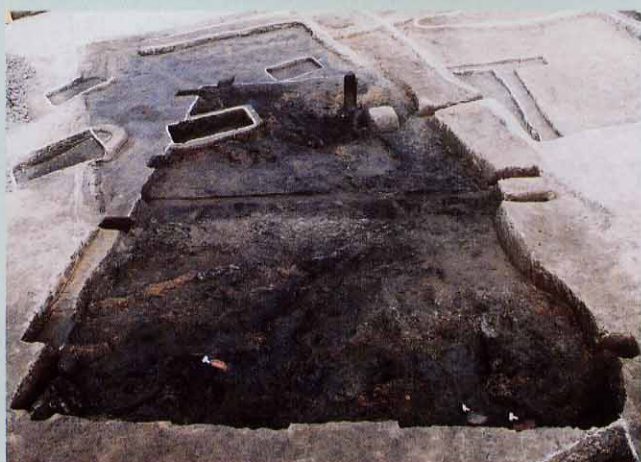
1. 近世の墓と溝跡に切られた竪穴住居跡 （火災にあって床に炭化材が散乱している）