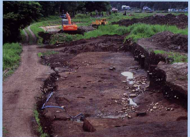
縄文時代の水場遺構