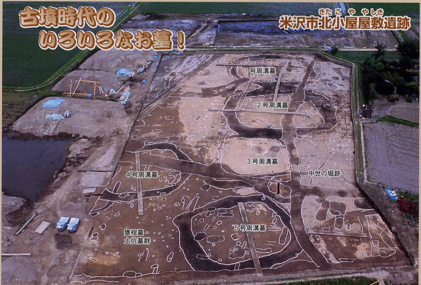
方形墳墓群の検出状況