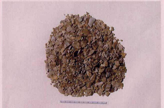
石屑の山：土を洗って篩 ふるい にかけ、9,779点の石屑 いしくず が回収されました。