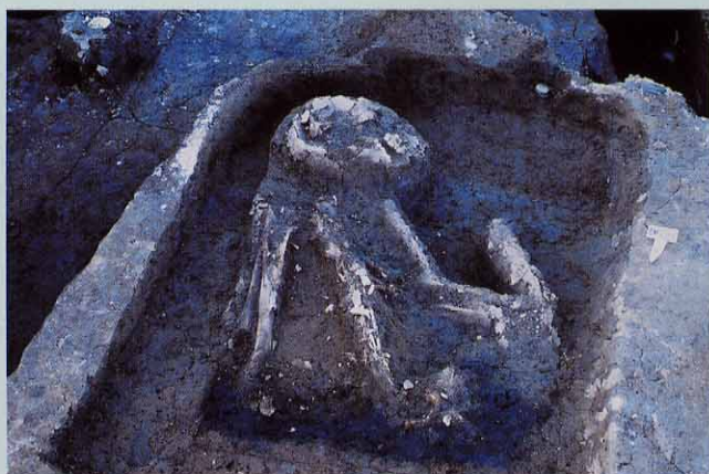
2. 人骨がほぼ完全な形で出土した近世墓