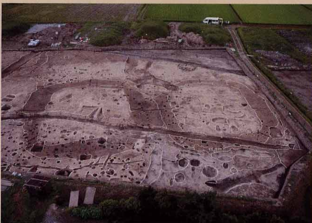
方形の周溝が重なり合う1号周溝墓と2号周溝墓

米沢市北部の北小屋屋敷遺跡では、平地に6基の方形の中型周溝墓群と、小型の甕棺墓や土坑墓群が検出されました。