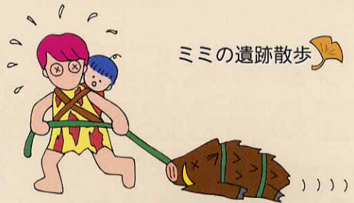
〈冬支度〉 …母はいそがしい…

米沢市西部、 なだら 斜平丘陵の麓に一ノ坂遺跡があります。現場は、緩やかな坂を少し登ったところにあり閑静な住宅地の一角に柵を施して保存してあります。平成元年、宅地造成の前に緊急の発掘調査をしたところ、大型の竪穴住居跡が発見されました。この住居は、今から約6,000年前の縄文前期初頭の住居跡で、全長43.5m・長楕円形の日本において最も長い住居跡です。住居内には、火を燃やす施設である地床炉を6基有し、柱穴が壁にそってほぼ等間隔に並んでいます。遺物は、住居内を中心に多量に出土しました。特に石器は、 せきぞく 石鏃・ りょうせんひしめ 両尖ヒ首・ せつび 石匙などを中心に、その製作途中のもの、製作断念のもの、製作失敗のもの、完成品など多量に検出されました。石器製作のうえで削りだされた剥片や未完成製品などは、床に敷き詰められその上に炭化したクルミを砕いたものを敷き、さらに微砂質の砂質層で覆い、意図的に埋められていました。