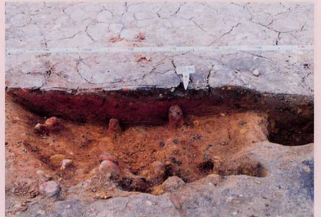
3号炉跡：厚い焼け土が認められます。