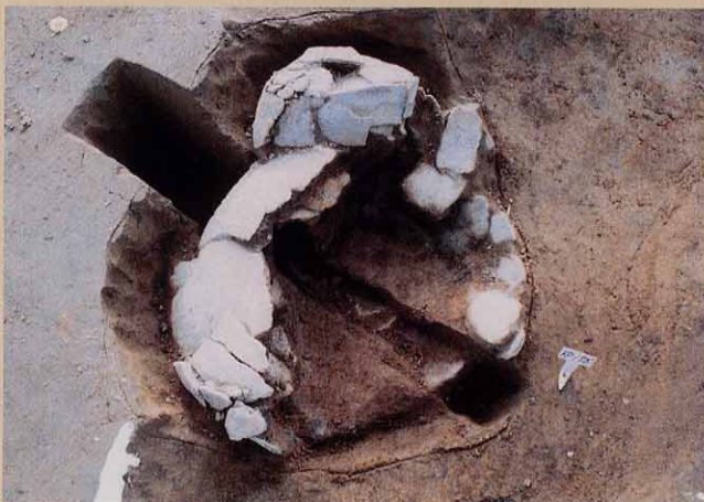
甕棺墓（口にはフタを被せている）