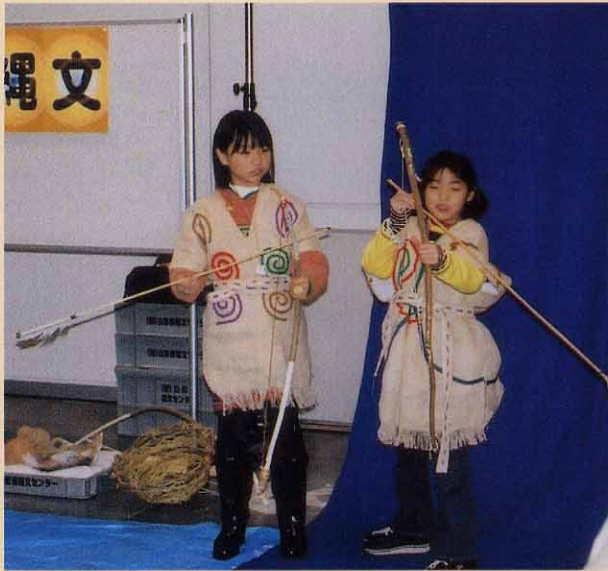
衣装や小道具を身に着けて、気分は早くも縄文人?!