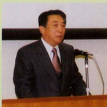
県教育長あいさつ