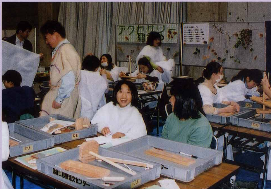
さあ、どんな形にしようか、ワクワク考えながら作ります。