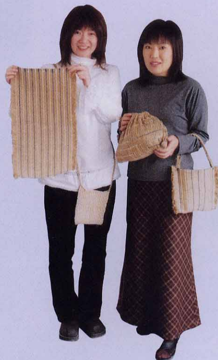
編布で作ったほかの作品です。今日でいうなら、コースター、バック、ポシェットといったところでしょうか。縄文時代にも同じような物が作られ、人々のくらしの中で使われていたのかも。