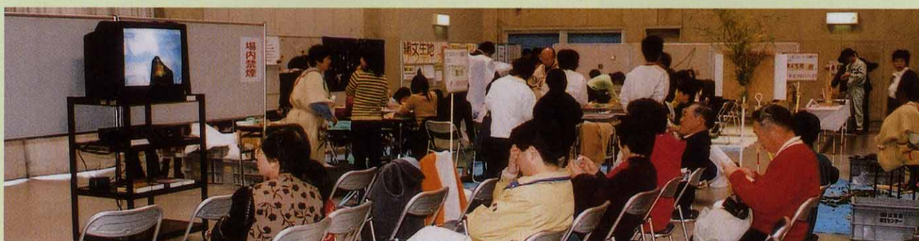
縄文文化についてのビデオ上映も行いました。