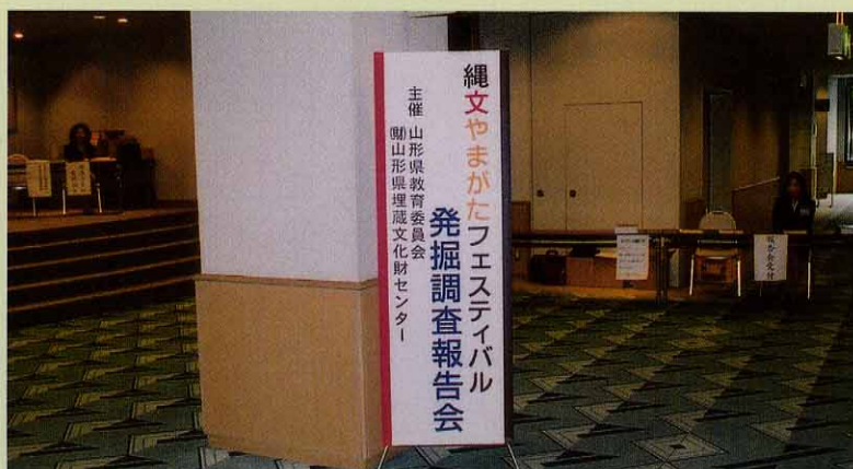
発掘調査報告会と記念講演が行われました。