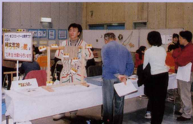
縄文の布（あんぎん）の再現！あんぎん台やこもづちなどの道具を使って編み布作り（コースター作り）。さあ、さっそく体験。