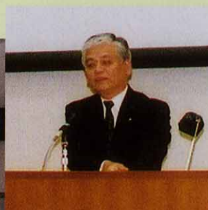
岡村道雄氏（文化庁記念物課主任文化財調査官）による記念講演「縄文の生活誌」。各地の発掘調査から明らかになってきた縄文時代の人々の生活について、スライド映写を交えながらお話していただきました。