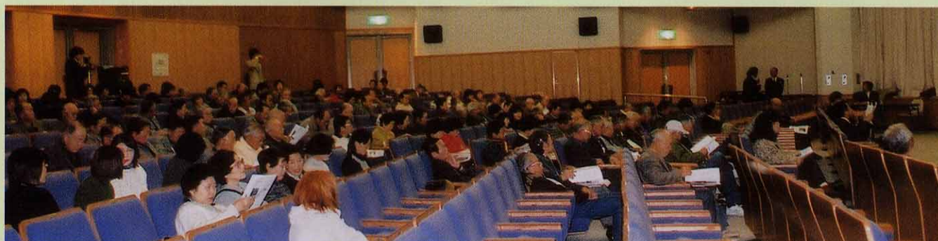
多くの来場者の皆さんが報告会と講演に熱心に耳をかたむけていました。