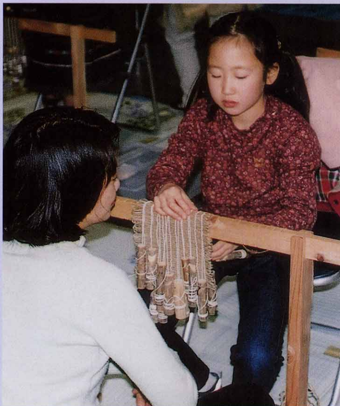
もうすぐ完成。あとは糸を結び、切るだけです。約1時間、編み始めると結構はまってしまいます。上手な出来映えに、お母さんも感心！