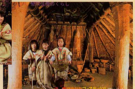
こんな記念合成写真ができました。まるで縄文時代にタイムスリップです!