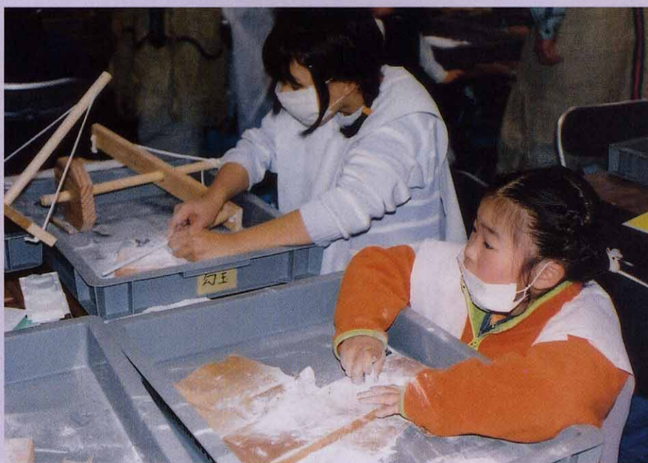
一番根気があるケズる作業。だんだん形ができてきたゾ！

「勾玉づくりって、ものすごく時間がかかる仕事だったんだね。」腕が痛くなってきたと言いながら、そんな言葉をもらす皆さんが多くいました。今回使った石材は滑石 かつせき という最も軟らかい石です。実際に滑石の勾玉も出土していますが、多くはヒスイやメノウなどのたいへん硬い石材で作られています。きっと、当時の縄文人は皆さん以上の感動を味わっていたのかもしれない。