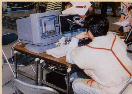
デジタルカメラで撮影した 画像はその場ですぐ編集です。 埋文センター職員の縄文人 がハイテクを駆使しています。