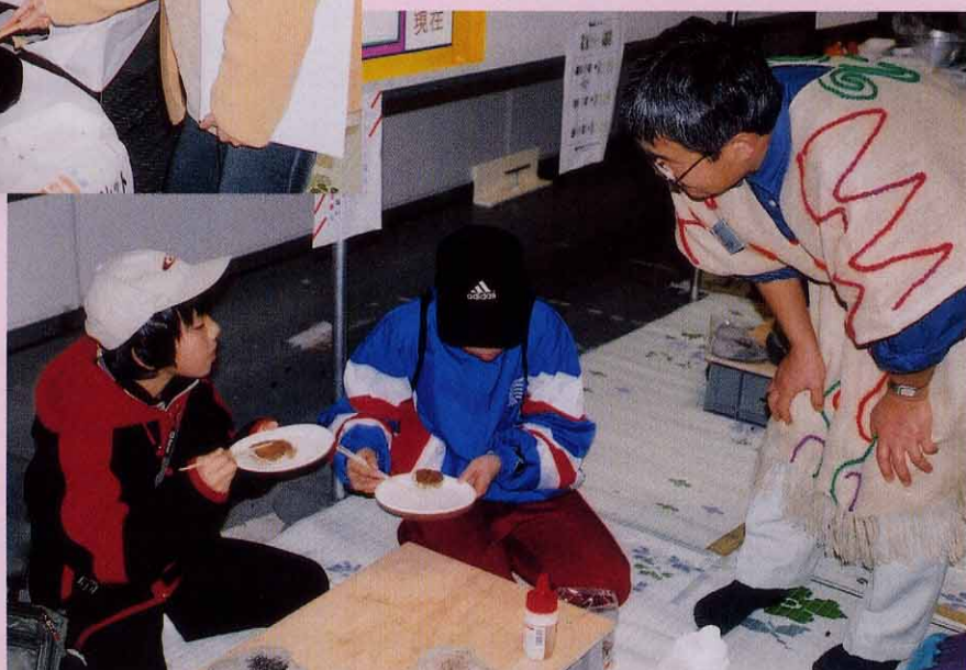
「ほんとに食べられるのかな?センターの人には悪いけど……。」