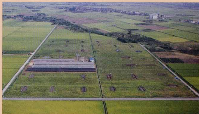
南から望む嶋遺跡