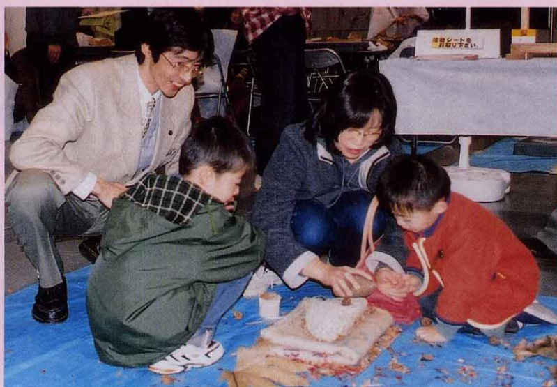
「へえ、石を使えばクルミが割れるんだ。お母さんって、すごいなあ!」