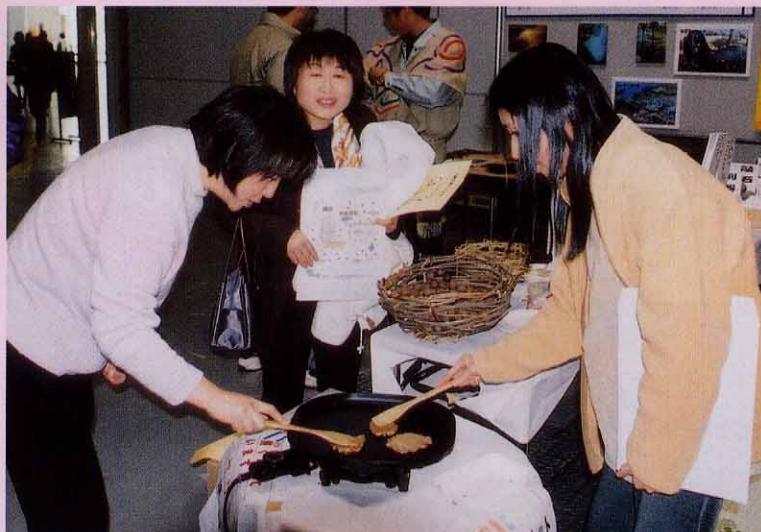
↑子供のチャレンジに負けじとはりきるお母さんトリオ?!