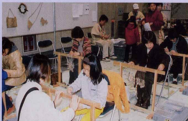
編み始めた参加者の皆さん。さすがに女性が多いようです。縄文のむかしに思いをよせて、1本1本丁寧に編み始めました。

編布（あんぎん）とは、糸の材料が植物の繊維で作られている縄文時代の布で、日本で最も古い布とされています。布の服を作るために始まり、その用途は土器を作る時の敷物や漆を漉すため、採集物を入れる袋などにも使っていたと考えられています。県内では1985年に高島町の押出遺跡から、約5500年前の編布が発見されました。箕の子や簾、俵などと同じ編み目になっている編布もあり、今日までその技術が受け継がれてきています。