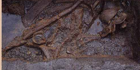
木製品出土の様子