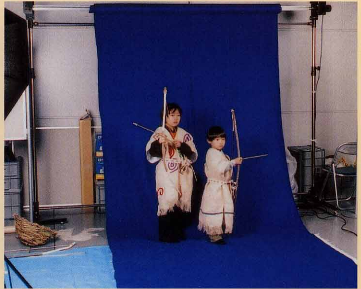
準備ができれば撮影です。 ハイ、ポーズ!! 特撮スタジオみたいですね!!