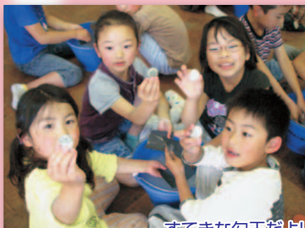
すてきな勾玉だよ!