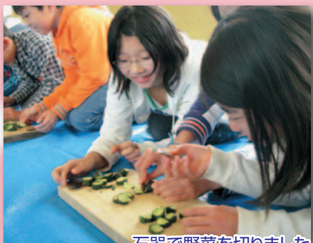
石器で野菜を切りました