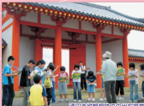
酒田市城輪柵跡での出前授業