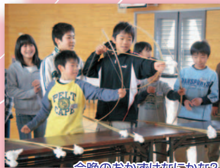
今晚のおかずはなにかな?