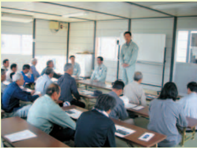
【真室川町】 滝ノ沢山遺跡