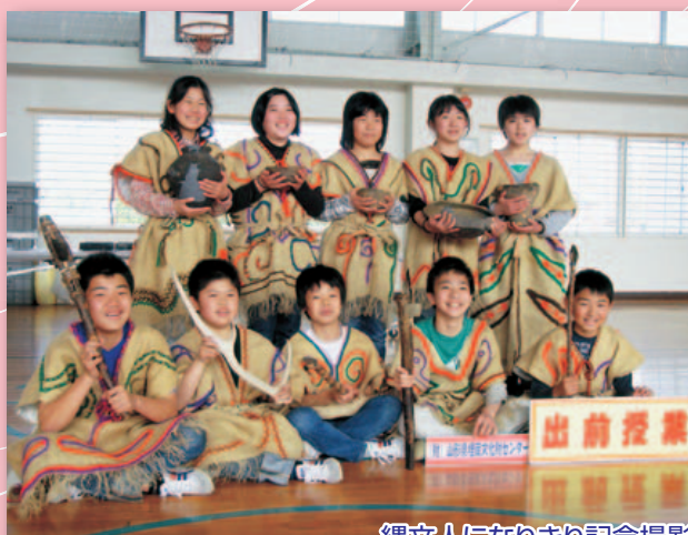
縄文人になりきり記念撮影