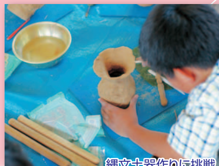
縄文土器作りに挑戦

今年度も出前授業をはじめ、センター見学・職場体験等を通してたくさんの友達と一緒に学習することができました。