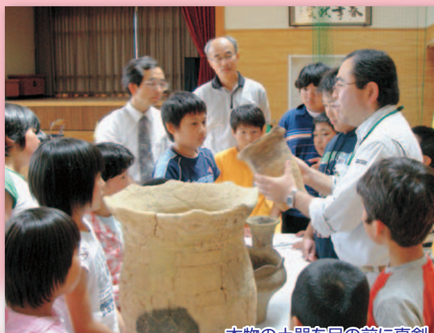
本物の土器を目の前に真剣