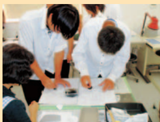
拓本体験 土器の模様を写し取ることができます。