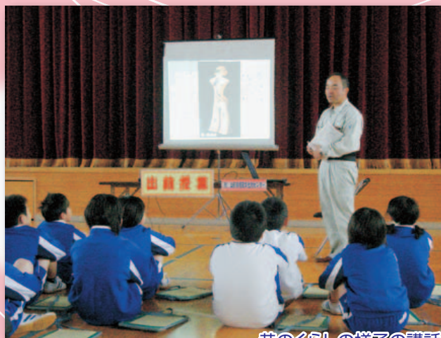
昔のくらしの様子の講話