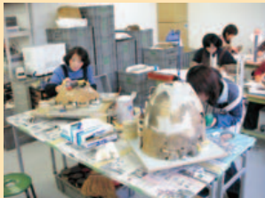
接合体験 土器の組み立てに挑戦