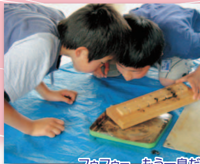
フッファー、もう一息だ