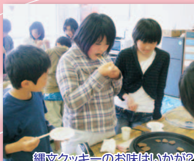
縄文クッキーのお味はいかが?