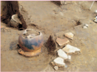
【山形市】 山形城三の丸跡 (国道112号)・山形城三の丸跡 (都市計画街路)・川前2遺跡 第4次