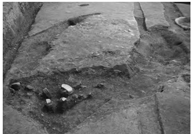
7区SX630縄文土器片検出状況 (←西)