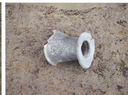
須恵器壺頸部出土状況