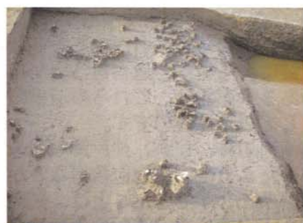
C区中央包含層遺物出土状況