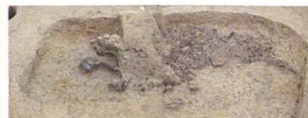
C区西端土坑出土状況