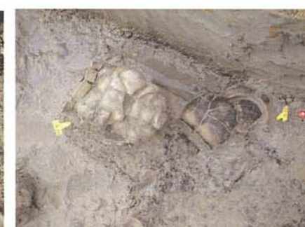
土師器甕出土状況