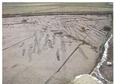
B区畝状遺構完掘状況