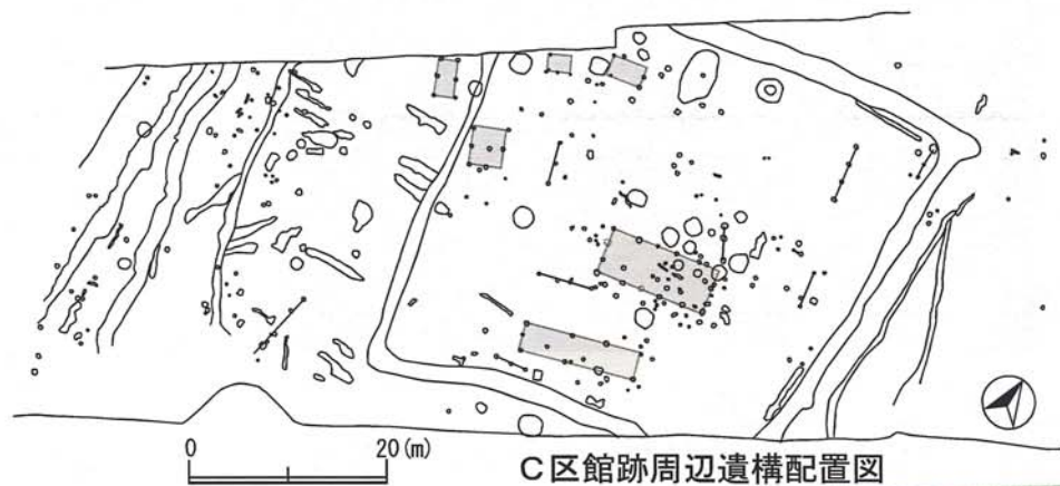
C区館跡周辺遺構配置図