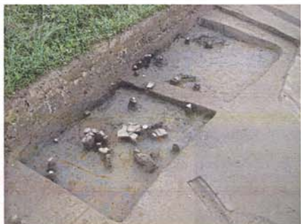
A区竪穴住居跡出土状況