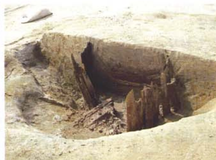
井戸跡の縦組み木柁出土状況