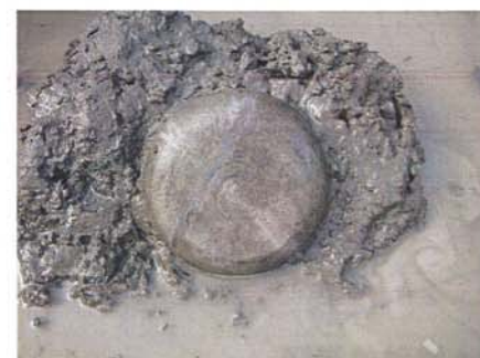
火だすきのある須恵器坏出土状況