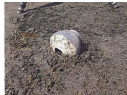
須恵器壺出土状況