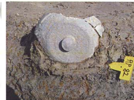
須恵器蓋出土状況