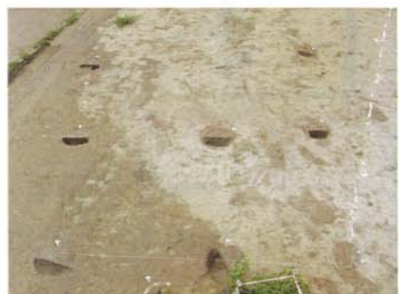
C区掘立柱建物跡完掘状況