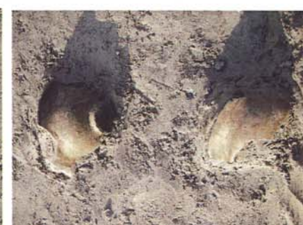
土師器坏出土状況