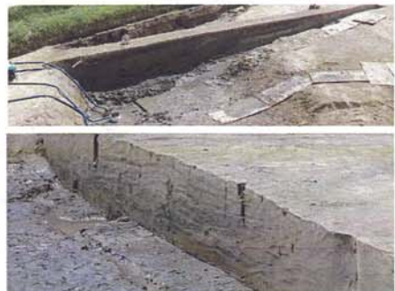
(上) A区河川跡断面 (下) B区河川跡断面