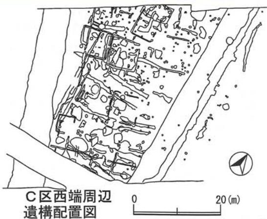
C区西端周辺遺構配置図