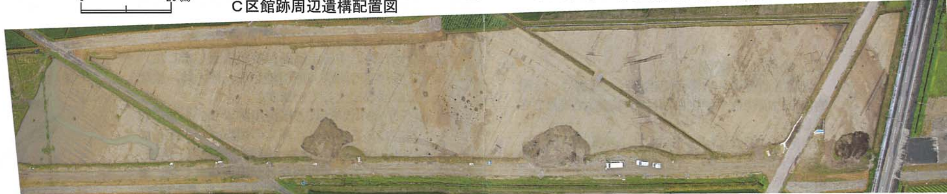
調査区全景俯瞰(合成、上が北)