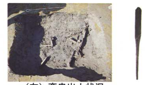
(左) 齋串出土状況 (右) 河川跡から出土した齋串