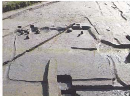
B区竪穴住居跡完掘状況