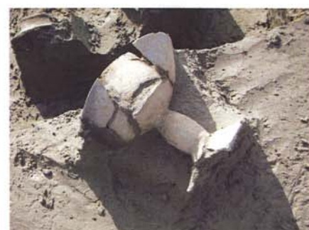
土師器高坏出土状況