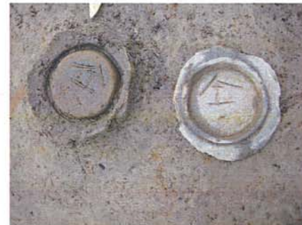
ヘラ書きのある須恵器坏出土状況