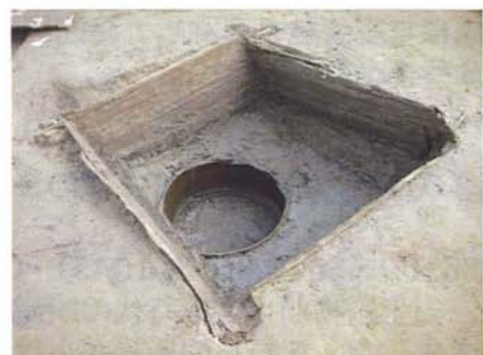
井戸跡の横組み木柁出土状況