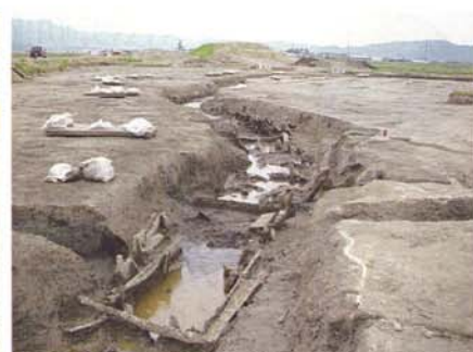
D区堰跡の木組み出土状況