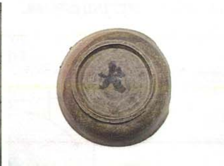
裏面に墨書のある坏