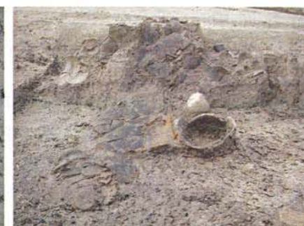
耳付土師器甕出土状況