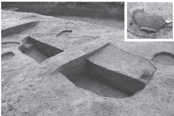
写真 3 SK8005 土坑の須恵器出土状況 (北東から)