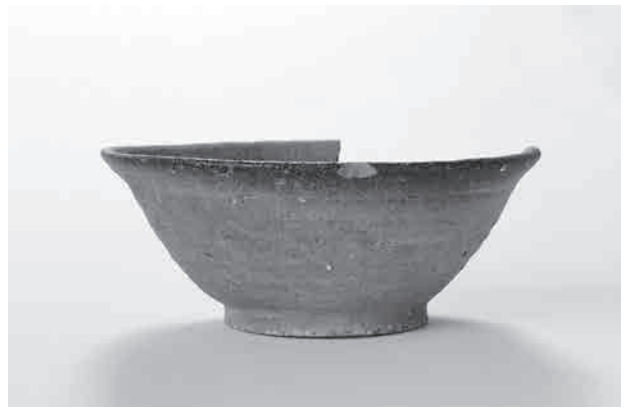
写真 4 SK8005 土坑出土の須恵器有台坏