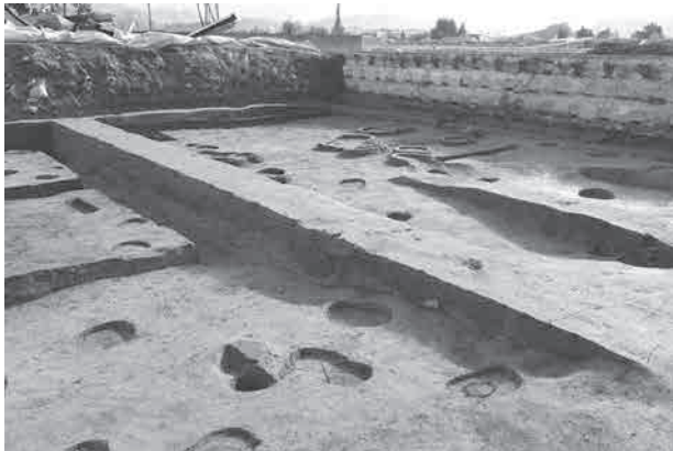
写真 1 SG8001 河川跡 (北西から)