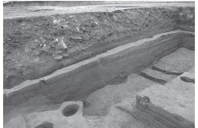
写真 2 ST8007・ST8014 竪穴住居跡 (北西から)