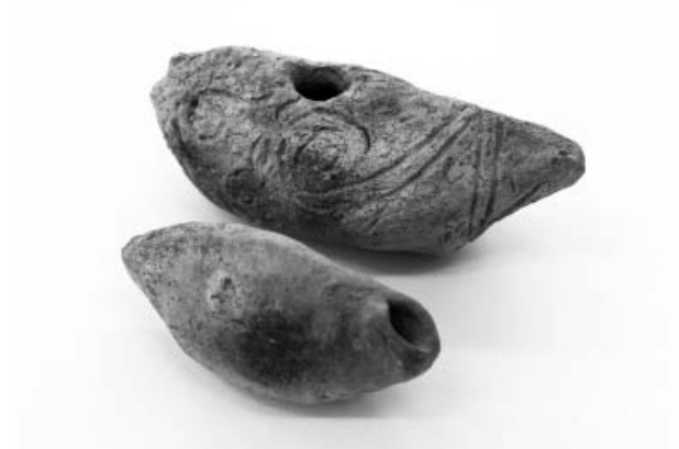
写真6 発見された袋状土製品

古代の遺物 また、ごくわずかであるが、須恵器や古代のものと思われる砥石が発見された。近隣の清水遺跡は、当センターの調査により平安時代の集落跡であることが明らかになっており、本遺跡にも平安時代のヒトが足跡を残していた可能性があると考えられる。