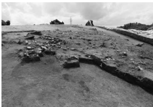
写真2 4区遺物出土状況（北から）