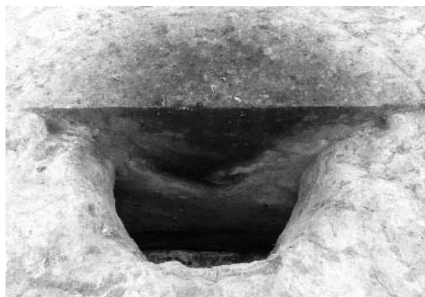
写真3 1区フラスコ状土坑（SK0012）堆積状況（東から）