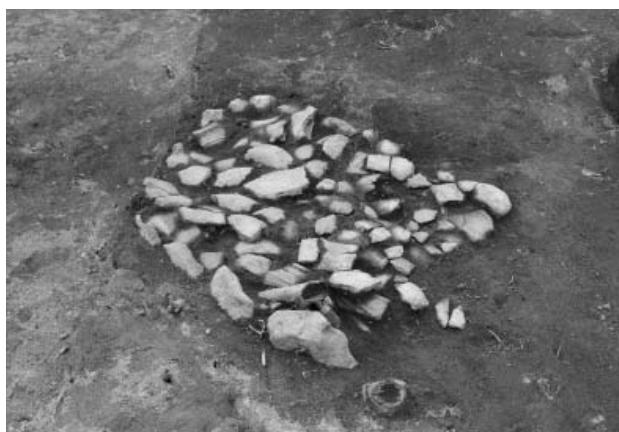
写真4 3区土器敷き石囲い炉（SL0229）検出状況（南から）