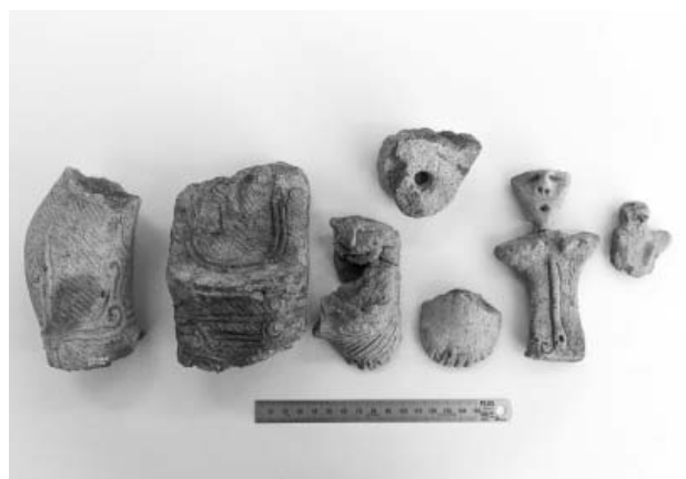
写真5 発見された土偶

ニチュア（小型のもの）までである。土偶は5体、あるいは7体発見されており、そのうち1体は一個体に復元できる（写真5）。もう1体は、脚部のみしか発見されていないが、大型で精巧な文様が施されている。また、国宝・西ノ前遺跡出土「縄文の女神」と同じ形と考えられる土偶も、腰部のみであるが発見された。さらに、2点の土笛と思われる袋状土製品（写真6）のほか、用途不明の円管形土製品も発見された。