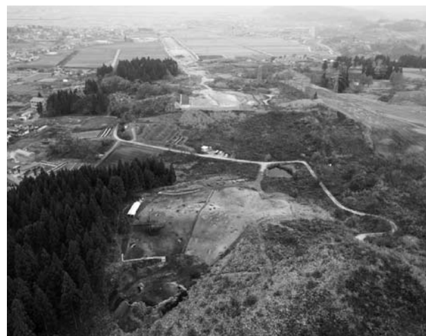
写真1 調査区全景（北から）

石 器 発見された遺物は、大量の縄文時代中期の土器片とともに、大きな石皿や すりいし 磨石、 なた 敲き石といった礫石器のほか、磨製石斧と、石鏃や石匙、錐形石器、ヘラ形石