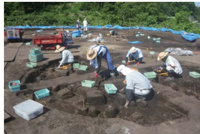
写真1 1区ST1調査状況(南から)

調査では、縄文時代後期・晩期の竪穴住居跡が確認され、より古い時期から集落が営まれていたことが明らかになりました。遺構の分布ですが、1区北半は主に縄文時代の遺構が分布し、2・3区は弥生時代の遺構が中心になるようです。今後、捨て場が分布すると思われる後半の調査区について発掘を進め、集落全体の様子を検討してゆく予定です。