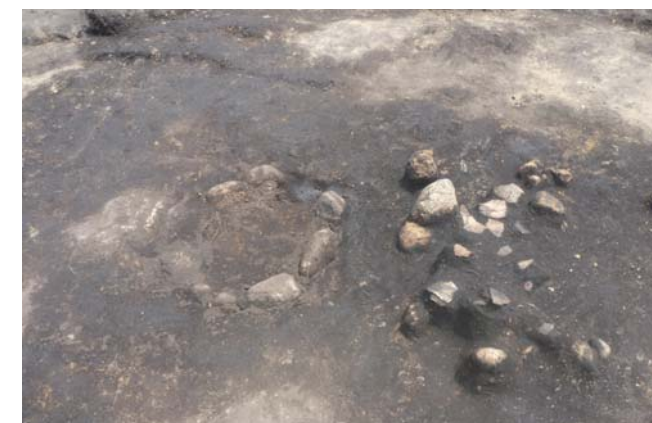
写真6 1区 ST38 炉跡検出状況 (南から)