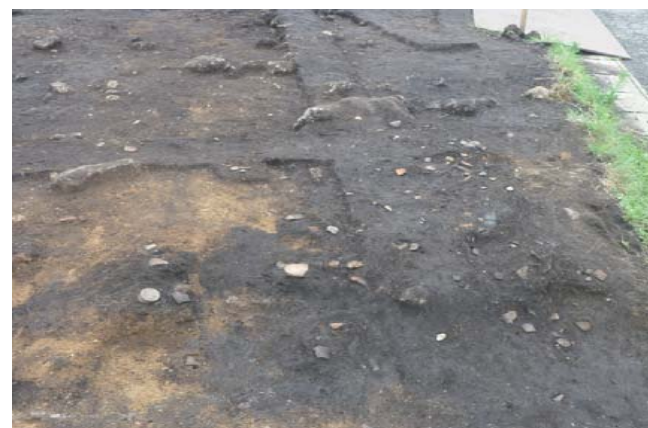
写真11 1区 SF60 遺物出土状況 (東から)