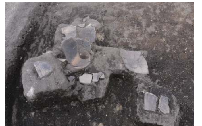
写真4 1区ST1RP46～50出土状況(北から)