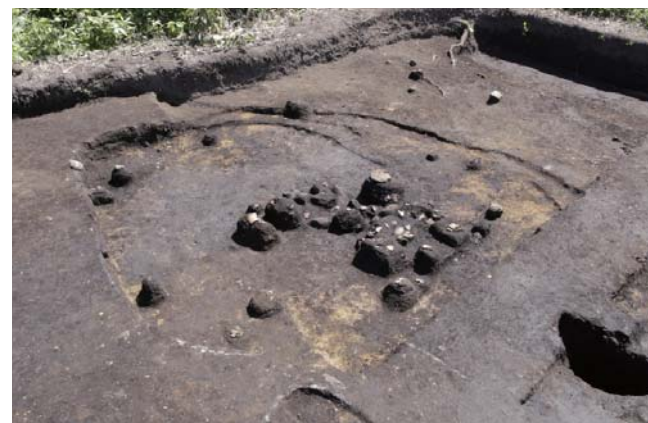
写真5 1区 ST38 遺物出土状況 (南西から)