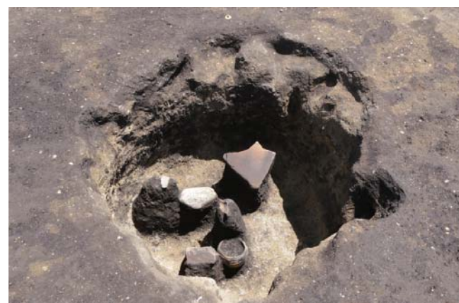
写真7 1区 ST38 遺物出土状況 (南西から)