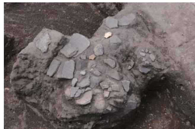
写真3 1区ST1RP45出土状況(北から)