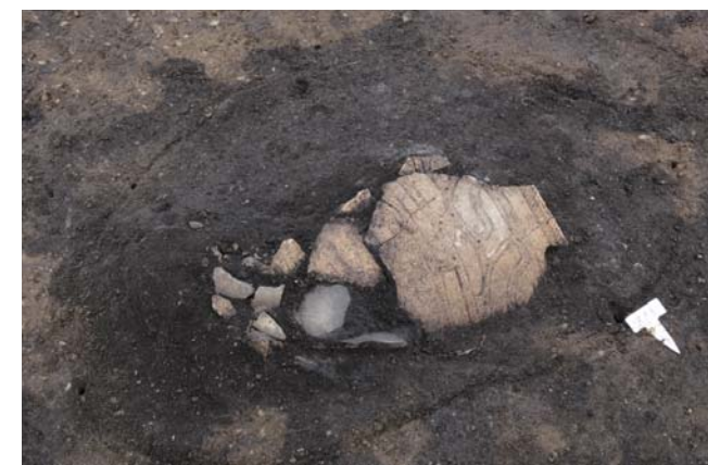
写真12 1区 RP5 出土状況 (北から)