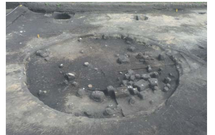
写真2 1区ST1遺物出土状況(西から)