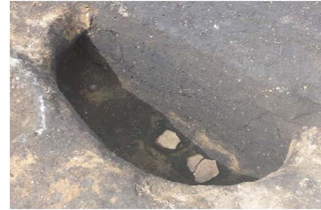
写真8 2区 SK9 断面 (南東から)