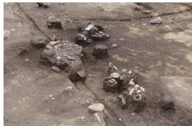
写真9 2区 SF3 遺物出土状況 (東から)