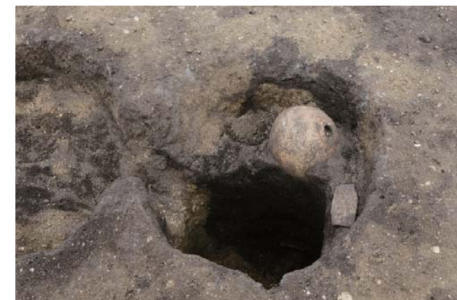
写真10 1区 SP16 遺物出土状況 (東から)