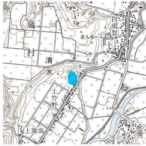
図 1 遺跡位置図 (1/25,000)