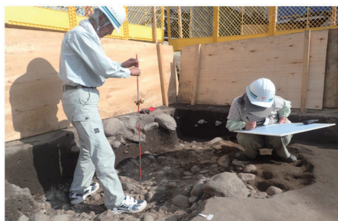
山形城三の丸跡第21次