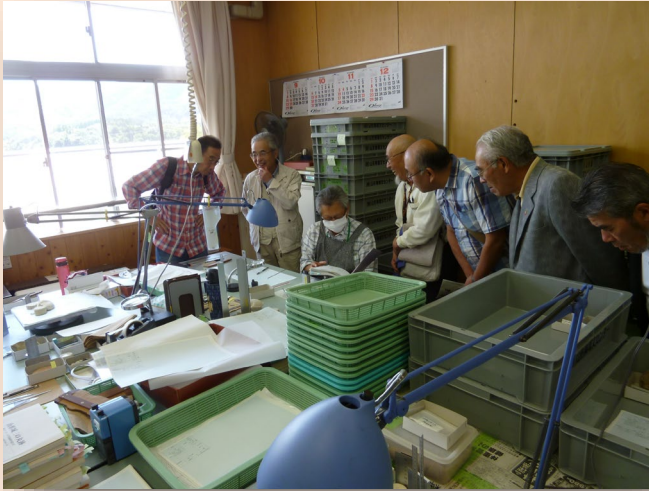
長瀬郷土史研究会 (9月19日)