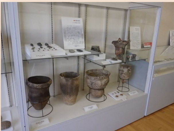
縄文時代の展示ケース