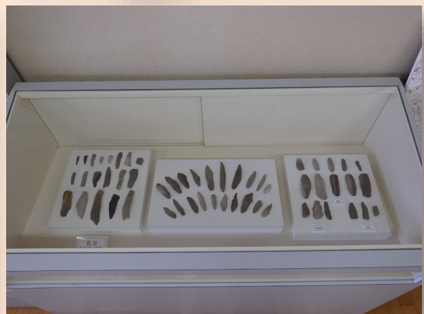
旧石器時代の展示ケース