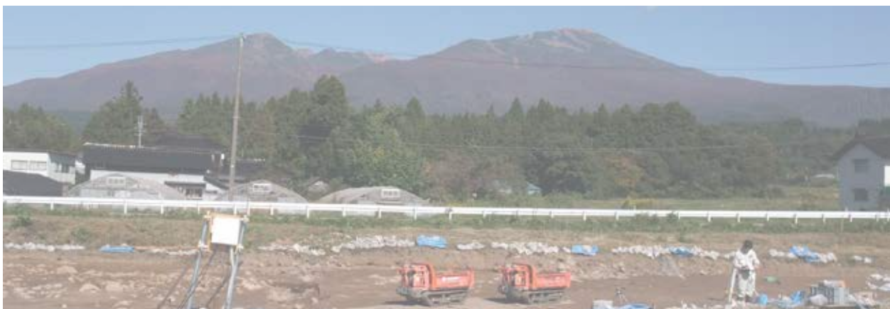
杉沢 C 遺跡