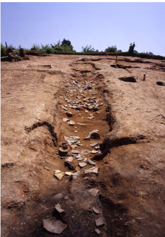
第 1 号窯跡

一般国道 287 号道路改築事業に伴い平成 17 年に発掘調査が行われました。斜面に へいあん 平安時代前期（9 世紀後半）に そうぎょう 操業されたと考えられる すえき 須恵器の かまあと 窯跡が確認されました。窯跡や周辺からは廃棄された不良品等も出土し、古代置賜郡における須恵器生産の様子が伺えます。