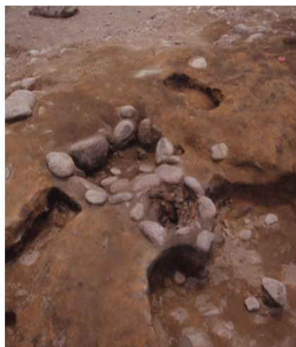
じゃくづれかまあと 蛇崩窯跡