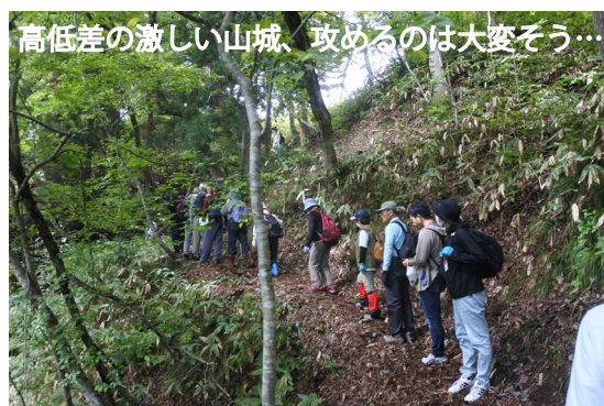
高低差の激しい山城、攻めるのは大変そう...