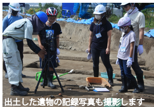
出土した遺物の記録写真も撮影します