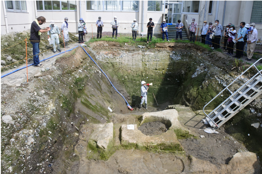
令和4年度 発掘調査現地説明会