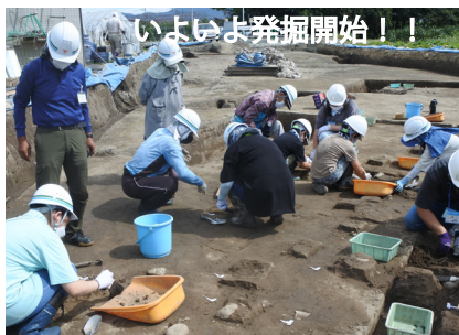
いよいよ発掘開始!!