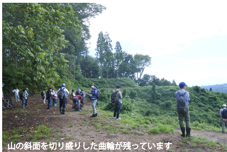
山の斜面を切り盛りした曲輪が残っています

大江町の左沢楯山城跡で遺跡体感ツーリズムを行いました。町の教育委員会で史跡整備がすすむ城跡を、町の担当者の説明を聞きながらめぐりました。地形を活かした要塞の構造に、参加者は息を切らしながら歩いていました。