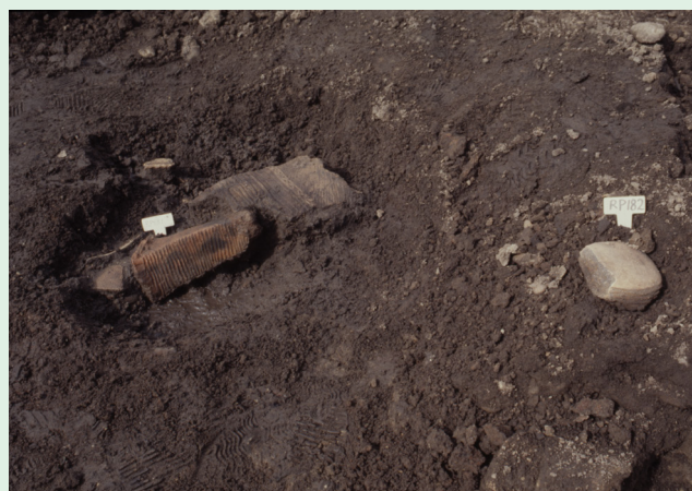
土偶の出土状況（腰部・左脚部）