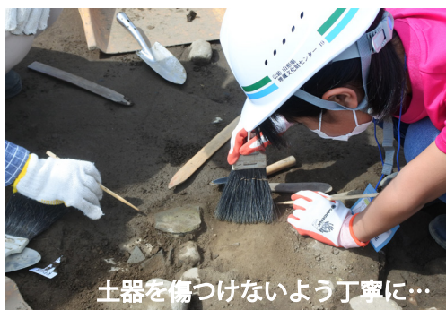
土器を傷つけないよう丁寧に...