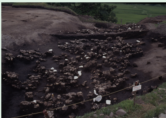
土偶が出土した沢跡