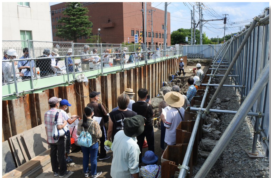
鶴ヶ岡城跡第4次調査