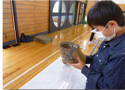
土器・石器を触ってみよう