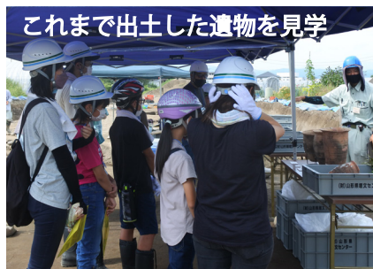
これまで出土した遺物を見学

山形市青柳の北向遺跡で発掘体験を行いました。三連休初日の当日は快晴の発掘日和です。山形市の親子を中心とした19名に参加していただきました。移植べらや箕(土を集める道具)などの発掘用具を使って遺跡を掘りました。