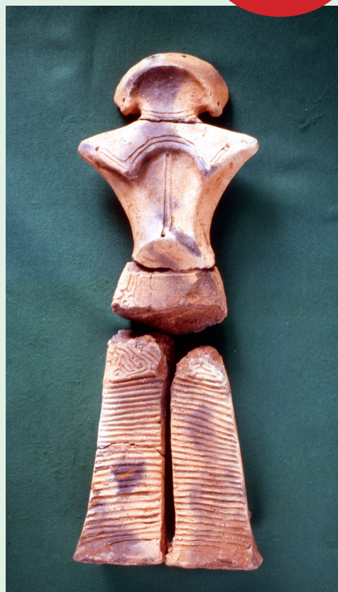
西ノ前遺跡出土土偶（接合前）

『縄文の女神』は平成24年（2012）9月に国宝に指定されました。現在山形県内には6点の国宝がありますが、考古資料としては唯一です。