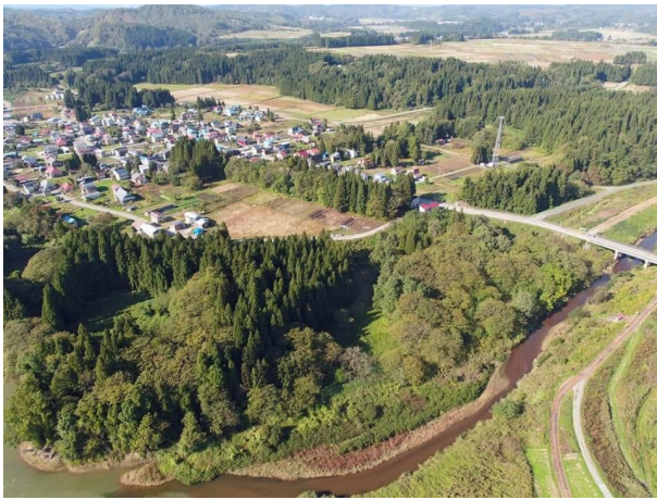
大石田町駒籠楯跡（推定野後水駅）と最上川