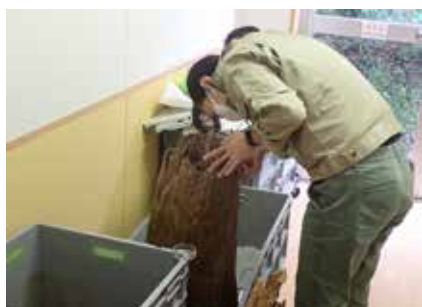
理化学分析試料の採取