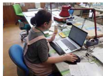
微細遺物の計測と入力