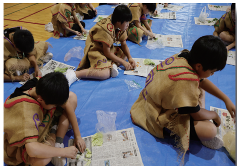
石器で野菜切り体験