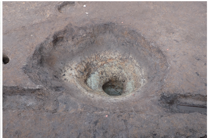
5 区井戸跡完掘状況