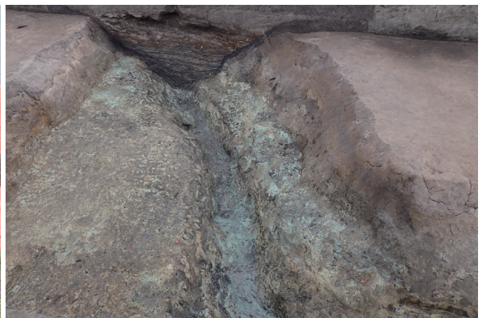
8 区河川跡完掘状況