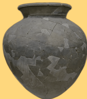
須恵器の大甕 泉森南窯跡(酒田市)