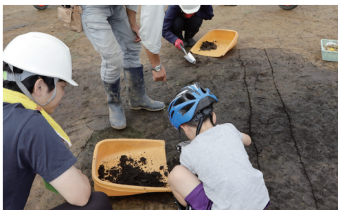
何か見つかったようです・・・!