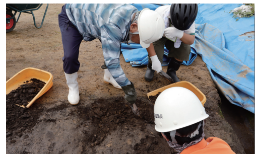
古墳時代の土器片が見つかりました!