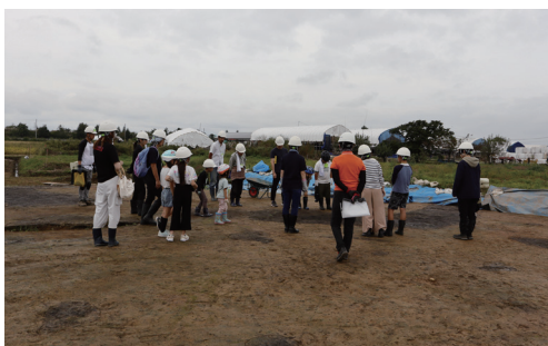
発掘作業の仕方を説明します

周辺の田んぼで稲刈りが盛んな中、高畠町船橋の西田1・2遺跡で発掘体験を行いました。参加者24名が、移植ベラや竹ベラなどの発掘用具を使って、昔の人々の生活の跡(遺構)を掘り下げました。今回の体験では遺構に堆積した黒色の土を丁寧に掘り進め、主に古墳時代の土器片が何点も見つかりました。体験後、親子で参加された方から「楽しかった」との声があり、こういった体験をさらに広げていきたいと感じました。