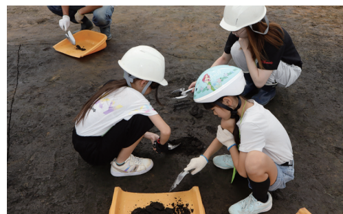
一生懸命掘り進めます