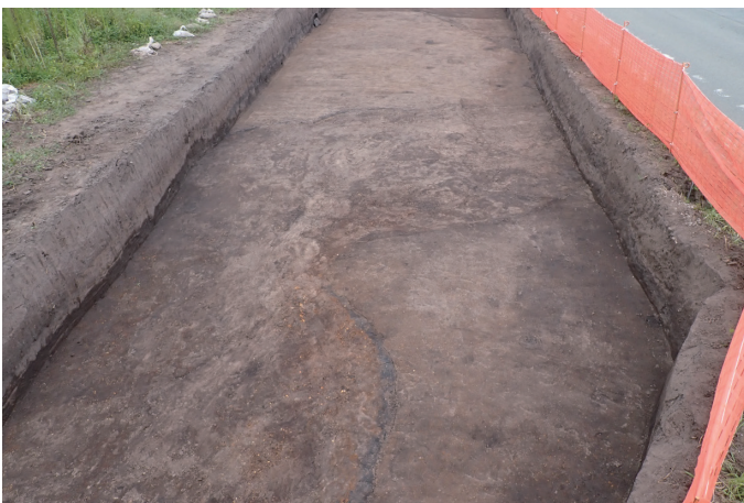
8 区河川跡検出状況