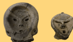
土偶 中川原C遺跡(新庄市)