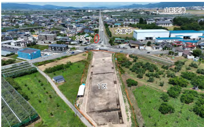
東原遺跡発掘調査区とその周辺（南から撮影）

この遺跡での暮らしぶりや周りの遺跡との関わりを明らかにするため、発掘調査と整理作業が続いています。