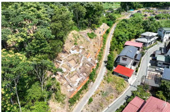
斜面地の調査の様子 (南西から)