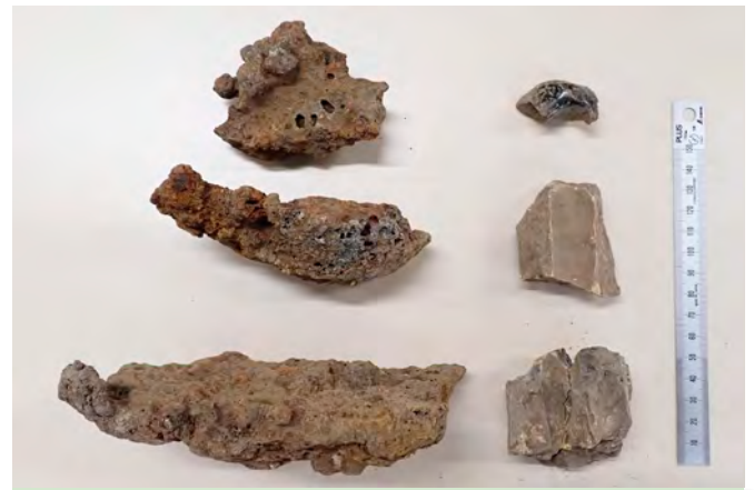
鍛冶に関する遺物（左：鉄滓、右：鞆羽口）