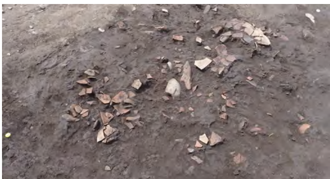
土器の欠片が大量に重なり合っで見つかりました。土器をまとめて捨てた場所だと考えられます。