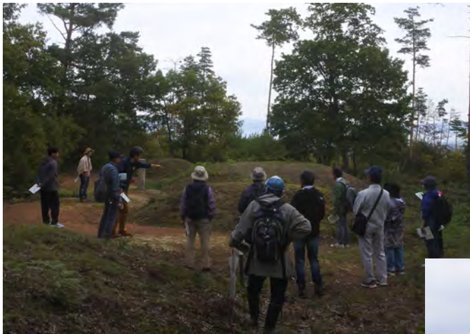
下小松古墳群最大の K50 号墳 墳丘がきれいに整備されています

国指定史跡にも指定されている東北有数の大古墳群、下小松古墳群（川西町）で遺跡体感ツーリズムを開催しました。参加者は14名で、川西町の担当者から古墳群の特徴などの解説を受けながら古墳群を散策しました。花火で熊対策をしながらの開催となりましたが、米沢盆地を一望できる絶景の中、古墳時代に思いをはせることができました。