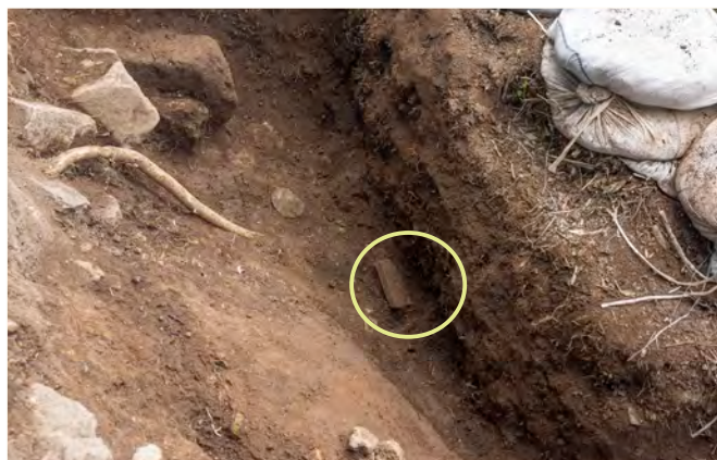
近世の瓦出土状況 (北西から)