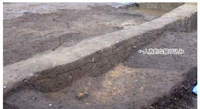
炭・焼けた土を含む落ち込みには、一部を人の手で掘り込んで形を整えたと考えられるものもあります。