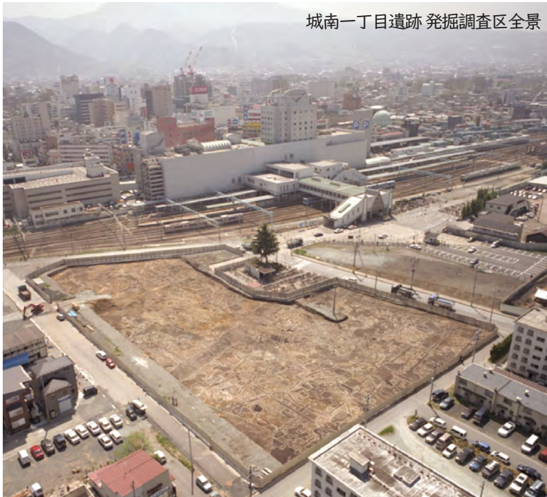
城南一丁目遺跡 発掘調査区全景