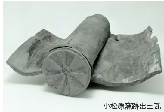
小松原窯跡出土瓦